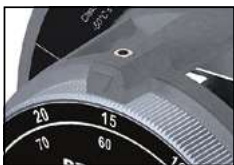
Винт фиксации кольца настройки